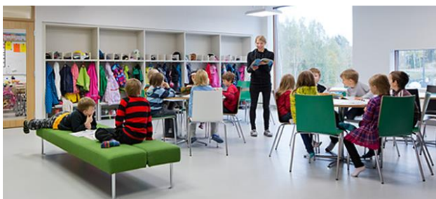
בית ספר בפילנד

סיכום: אם הרבה מהדימויים שליליים, אז למה בכלל ב"ס? (5 דקות)