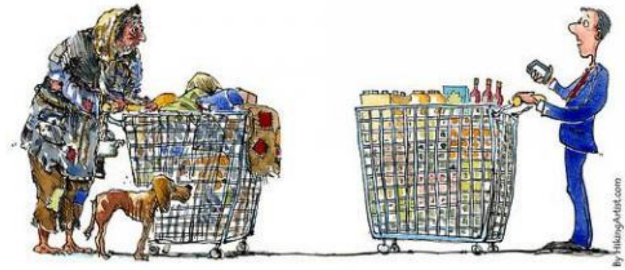
איור: Flicker, theHikingArtist.com , (מקוון)

נציג לתלמידות/ים את התמונה הבאה (שקף 1 במצגת):