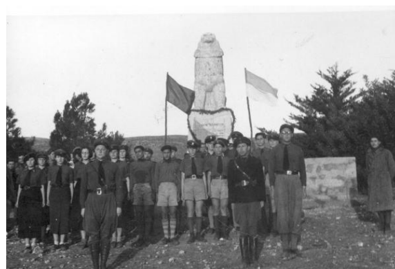
תנועת בית"ר בתל-חי, 1929

ילדים ובני נוער עלו מדי שנה לתל חי ושיננו את המילים של טרומפלדור. ספרי לימוד, פרקי לימוד, מחזות ושירים נכתבו על טרומפלדור, ובשורת תל חי הגיעה גם אל רחבי הגולה היהודית. כולם אימצו את תל-חי, הן מהשמאל והן מהימין, כל אחד בהתאם לאידיאולוגיה שלו.