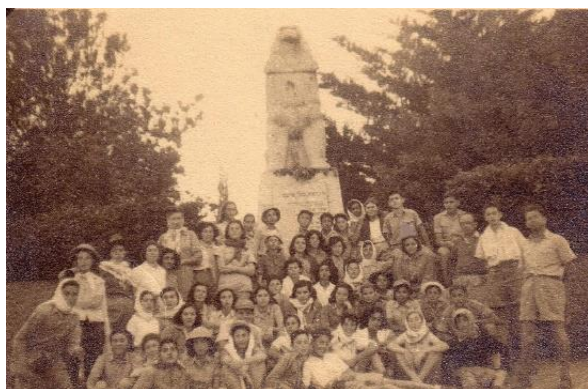
טיול בית ספר יסודי מראשון לציון, 1949